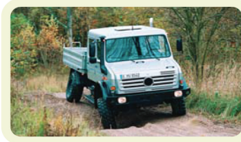
Une tenue de route optimisée sur tous types de sols.